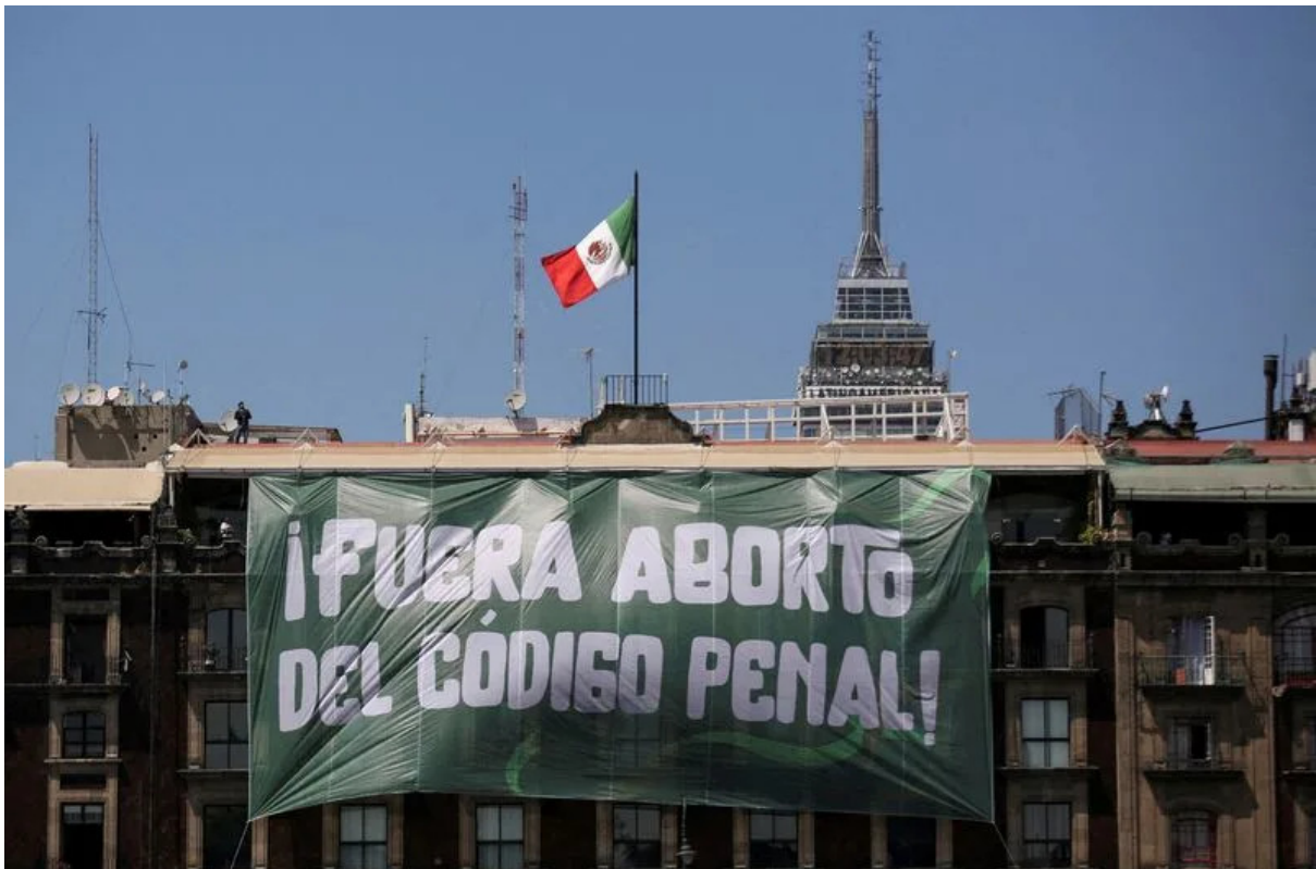
Imagen de archivo. Una pancarta es vista en un edificio durante el Día Internacional de la Mujer, en la Plaza del Zócalo en Ciudad de México, México. 8 de marzo de 2023.

"La cuestión no es la capacidad, sino la voluntad política", afirmó Alcalde.